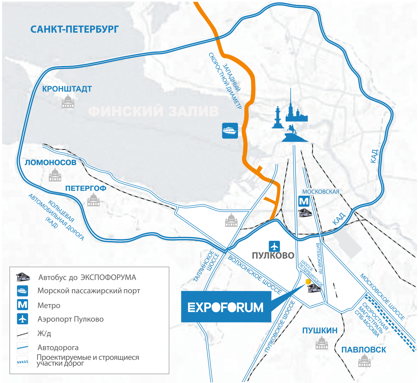
СХЕМА ПРОЕЗДА ДО ВЫСТАВОЧНОГО ЦЕНТРА «ЭКСПОФОРУМ»